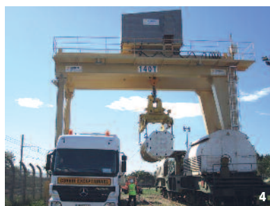
4- AREVA Container unloading gantry crane on Marcoule rail terminal